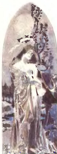
• Михаил Врубель, «Философия»