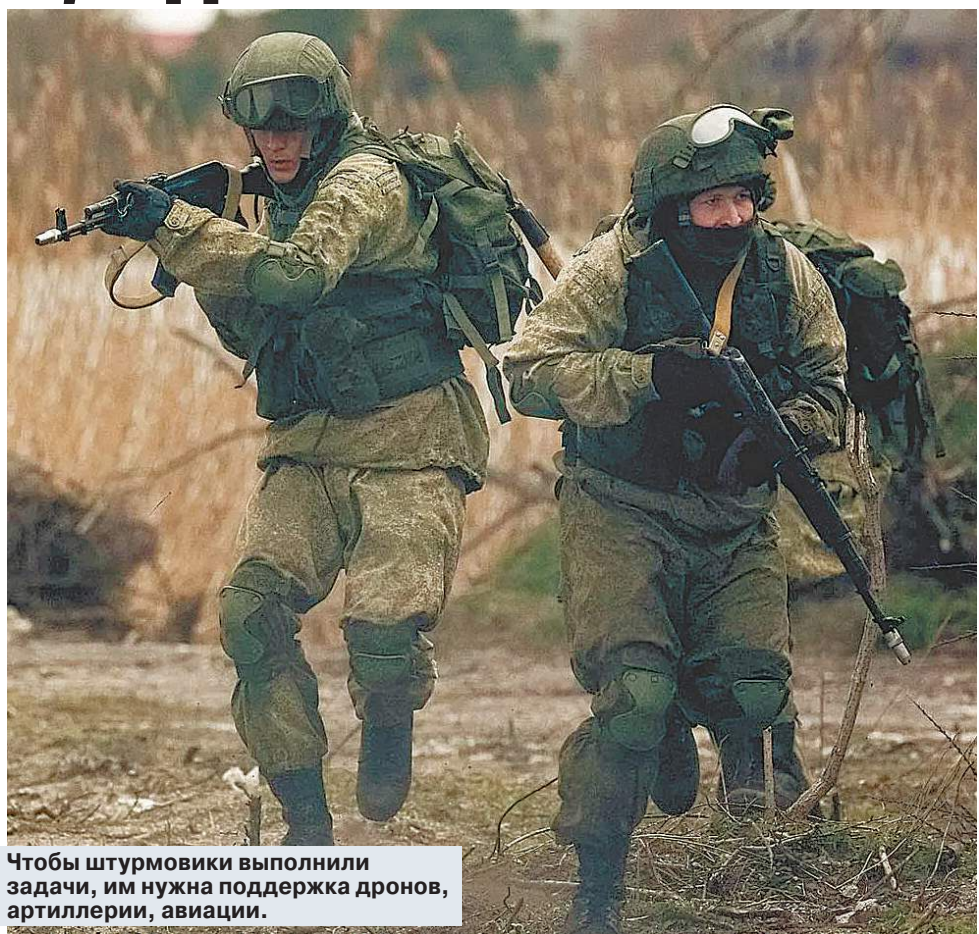
Чтобы штурмовики выполнили задачи, им нужна поддержка дронов, артиллерии, авиации.