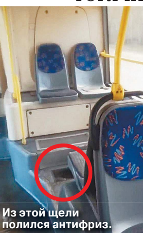
Из этой щели полился антифриз.

стал тормозить, чтобы хоть как-то выровнять транспортное средство. Далее, на развороте, когда он снова нажал на тормоз, то прямо из-под пола на мужчину и его дочку вырвался фонтан, как потом выяснилось, антифриза. Позже водитель рассказал, что за неделю до этого ЧП автобус был на ремонте.