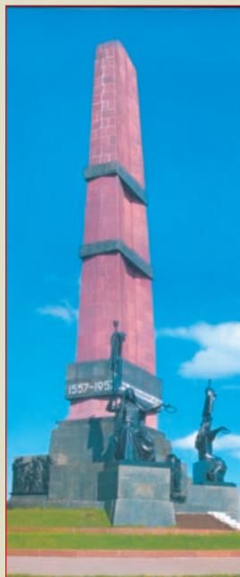
Памятник, воздвигнутый к 400-летию добровольного вхождения Башкирии в состав России