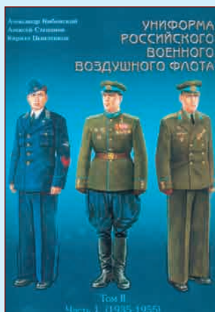
▲ Обложка книги том II, часть 1