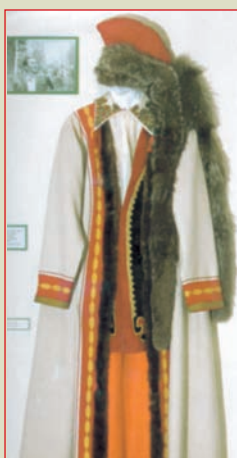
Башкирский национальный мужской костюм

Рисунок из книги И.-Г. Георги «Описание всех в Российском государстве обитающих народов». 1776 г. РГАДА