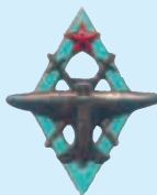
Нагрудные знаки образца 1938 г. пилотов, окончивших (с отличием и без) военно-авиационную школу ВВС РККА