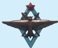
Нагрудный знак образца 1938 г. летчика, окончившего военно-авиационное училище

Реконструкция на основе рисунков В.Н. КУЛИКОВА