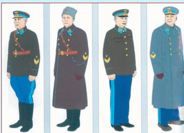
Рисунки повседневной формы одежды генералов авиации Красной армии, установленной приказами НКО 1940 г. № 212 и 373

Реконструкция на основе рисунков В.Н. КУЛИКОВА