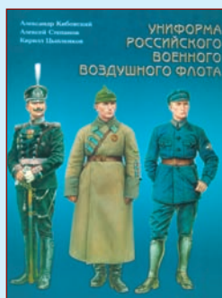
▲ Обложка книги том I