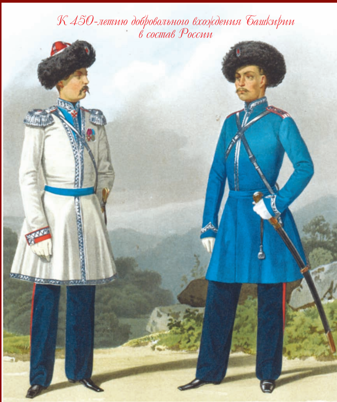
Генерал и штаб-офицер Башкирского войска. В парадной и обыкновенной формах, 1857 г. Из коллекций Военно-исторического музея артиллерии, инженерных войск и войск связи (Санкт-Петербург)

5 декабря — День начала контрнаступления советских войск против немецко-фашистских войск в Битве под Москвой (1941). День воинской славы России