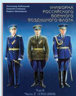
▲ Обложка книги том II, часть 2

Маршал авиации А.А. Новиков в повседневных погонах, установленных Указом Президиума Верховного Совета СССР от 1 февраля 1943 г.