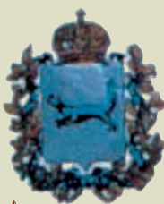
Герб Уфимской губернии