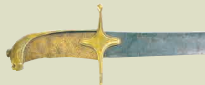
Сабля Салавата Юлаева