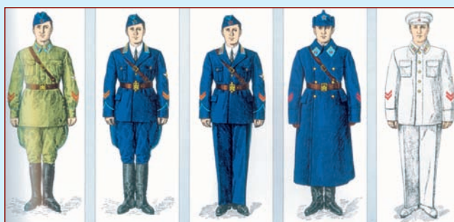
Рисунки формы одежды комначсостава ВВС (с элементами реконструкции) из Правил ношения формы одежды 1936 г.

*Кибовский А.В., Степанов А.Б., Цыпенков К.В. Униформа российского военного воздушного флота: В 2 т. Т. 2, Ч. 1 (1935—1955). М., 2007. 456 с.