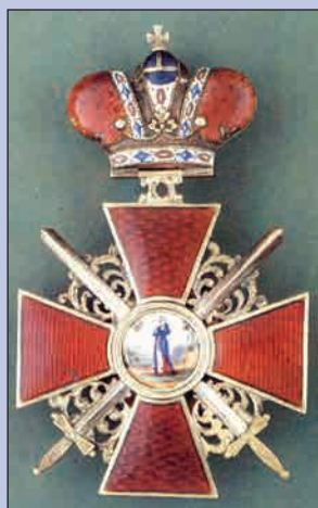
Знак ордена Св. Анны с мечами, украшенный короной