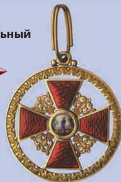
Знак официальный ордена Св. Анны