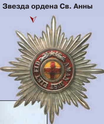
Звезда ордена Св. Анны