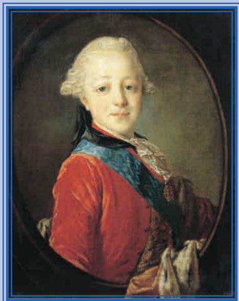
Портрет Великого князя Павла Петровича в детстве Художник Ф.С. Рокотов, 1761 г.