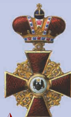
Крест ордена Св. Анны II степени с короной для нехристиан