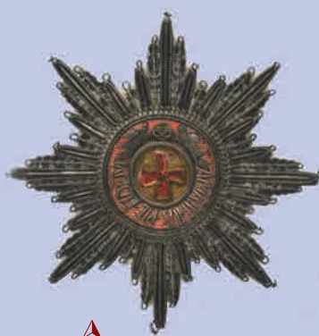
Звезда ордена Св. Анны