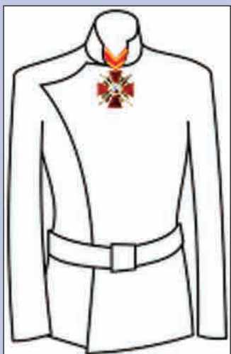
Орден Св. Анны 2-й степени