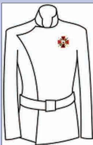
Орден Св. Анны 3-й степени (ленточка условно не показана)