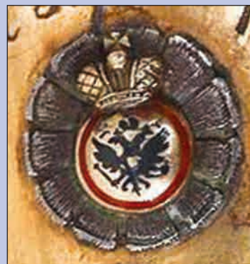
Знак ордена Св. Анны 4-й степени для офицеров нехристианской веры на шашке 1841 г.