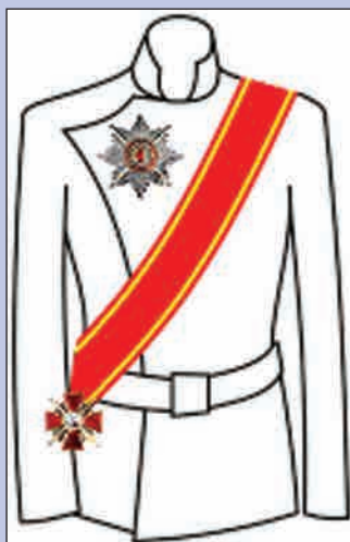
Орден Св. Анны 1-й степени