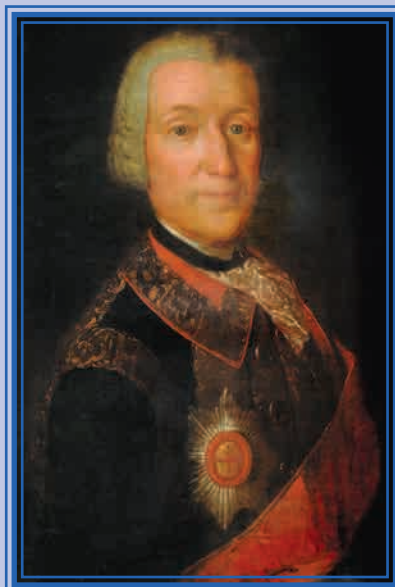
Ф.И. Голицын — генерал-майор Неизвестный художник