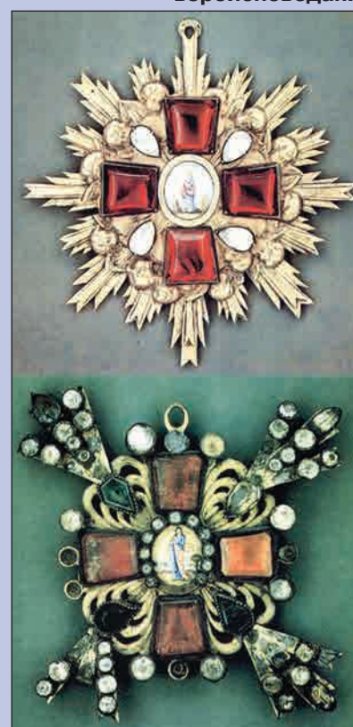
Разновидности знаков ордена Св. Анны конца XVIII в.