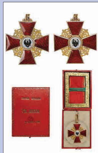
Копия знака ордена Св. Анны 2-й степени для лиц нехристианского вероисповедания