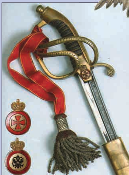
Аннинская сабля 1867 г. с темляком. Показаны два варианта знака ордена Св. Анны 4-й степени: обычный с красным крестом и с изображением царского орла для награждения нехристиан