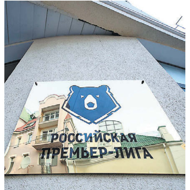
Дарья Исаева «СЭ» / Canon EOS-10 X Mark II