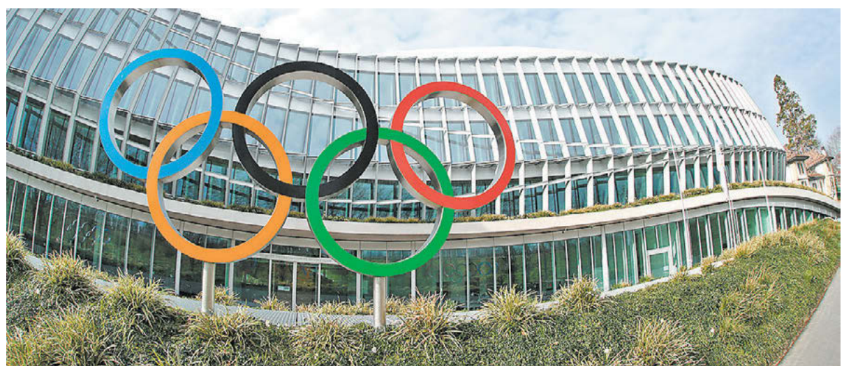
Вчера. Лозанна. В штаб-квартире МОК верят в быструю победу над коронавирусом