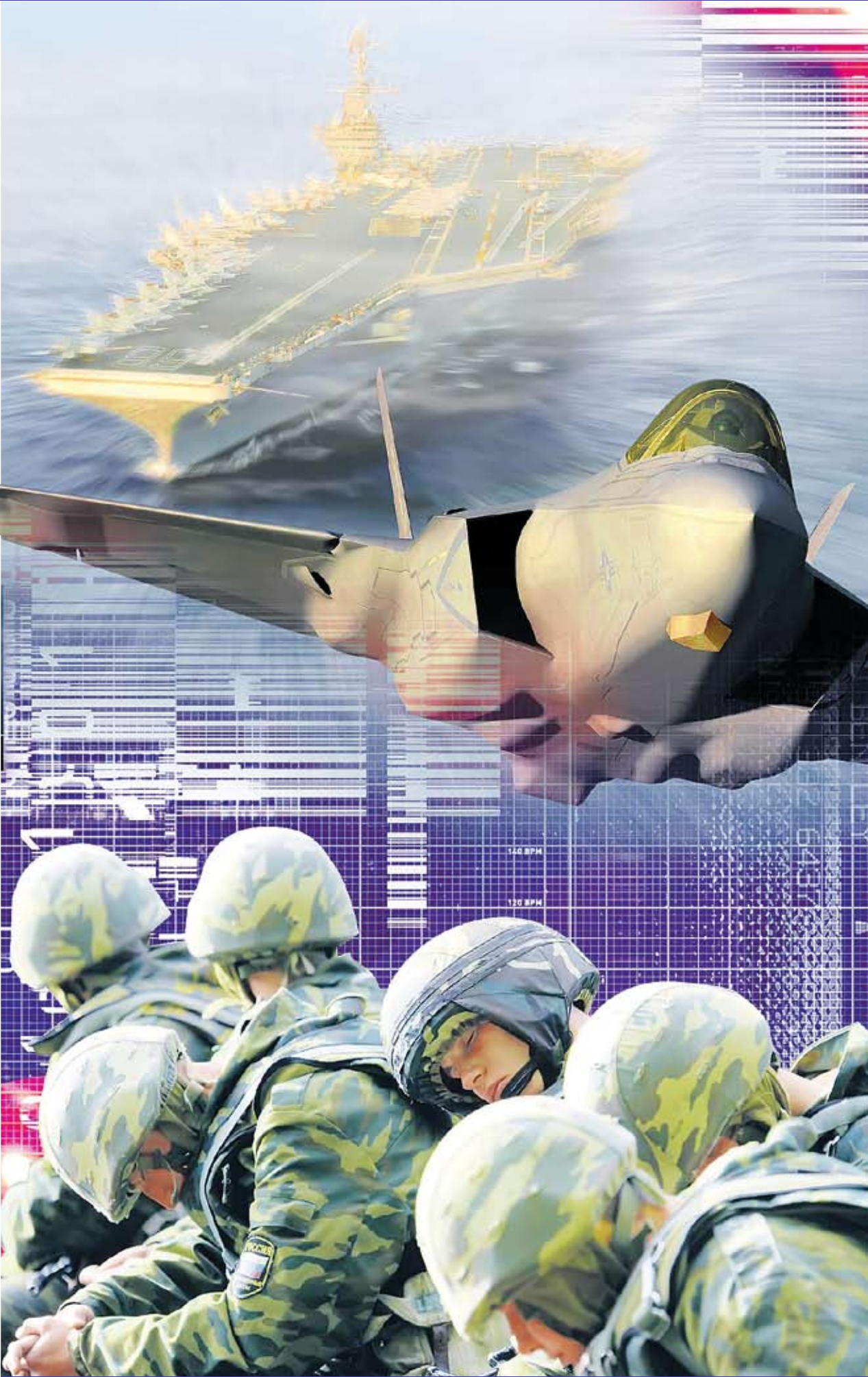
Коллаж Андрея СЕДУХ

Увы, Российская армия в настоящее время к высокотехнологичной войне не готова. Она не имеет, к сожалению, практически ничего из того, что помогло американцам так быстро и эффективно разгромить войска Саддама Хусейна. У нее пока нет сравнимых по ТТХ с лучшими мировыми образцами АСУ, позволяющими эффективно управлять разнородными группировками. Глобальная навигационная система ГЛОНАСС находится в стадии развертывания, поэтому при-