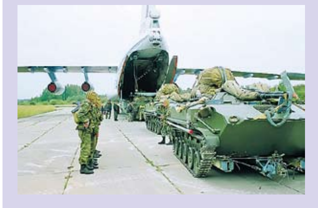
По сообщениям корреспондентов «ВПК», информистента АРМС-ТАСС и Интерфакс-АВН

После выброски десантники провели сбор на площадке приземления и уничтожили объекты условного противника. Затем полк совершил марш на полигон Струги Красные, где продолжилось полковое тактическое учение.