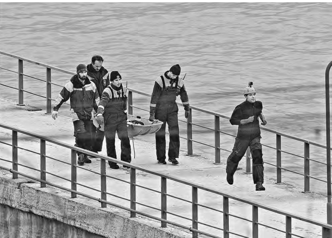
Первые страшные находки спасателей доставлены на берег.

Президент Владимир Путин, находящийся в эти дни с рабочей поездкой в Санкт-Петербурге, выразил соболезнования семьям погибших. «Завтра в России будет объявлен общенациональный траур», — сообщил он. Это отразится и на проезде самого Путина. Сегодня он должен был присутствовать на музыкальном световом представлении на Дворцовой площади, но в связи с трауром отменил свое участие в мероприятии. Со словами скорби к семьям и родственникам жертв авиакатастрофы обратился премьер-министр Дмитрий Медведев: «Эта страшная трагедия унесла жизни людей, полных сил и планов. В числе погибших — журналисты, военнослужащие и музыканты знаменитого ансамбля имени Александрова. Они летели в Сирию с очень доброй и мирной миссией. С этой тяжелой утратой невозможно смириться, она невосполнима. Сегодня это большое горе разделяют миллионы людей». Президент поручил главе правительства сформировать комиссию, которая займется изучением обстоятельств происшествия. «Будет проведено тщательное расследование причин катастрофы и сделано все, чтобы оказать поддержку семьям погибших», — заверил Путин. По распоряжению Дмитрия Медведева в состав правительственной комиссии вошли представители всех ключевых ведомств. Ее работу возглавил министр транспорта Максим Соколов, который незамедлительно вылетел в Сочи.