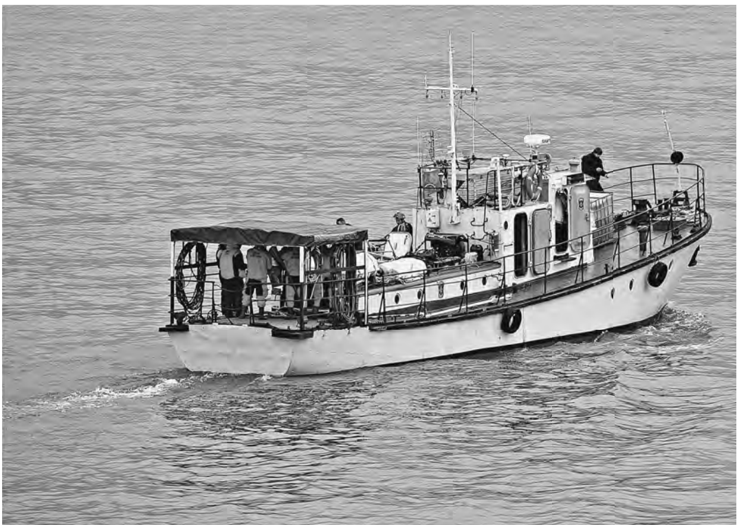
Обследование района катастрофы продолжается и с моря, и с воздуха.