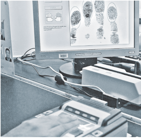
Отпечатки пальцев снимают у всех, кто собирается в Польшу.