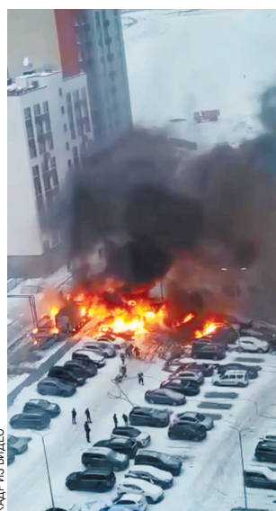
КАДР ИЗ ВИДЕО

Банальная неосторожность привела в среду утром к ужасному пожару на улице Бориса Пастернака в Новой Москве. Как свечка вспыхнула ярким пламенем сразу 8 машин на парковке возле строящихся жилых домов. Причиной стало нелепое поведение, скорее всего, могла стать случайная искра от дровяной печки, которую топили строители.