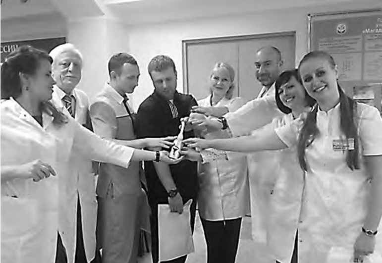
Штат Магаданской больницы пополнили узкие специалисты.