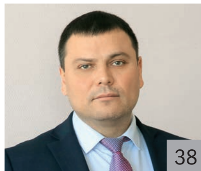
В. В. КАЗАКОВ, исполняющий обязанности заместителя председателя Правительства Республики Коми — министра финансов