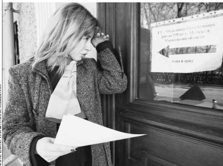
В отделении Пенсионного фонда обозревателя «Известий» никто не ждал

— Какой тебе Пенсионный фонд? Найди частную управляющую компанию, туда и звони, — увещевала меня коллега. Но инструкция Пенсионного фонда говорила другое. И я ей поверила. Это была вторая ошибка. → стр. 2