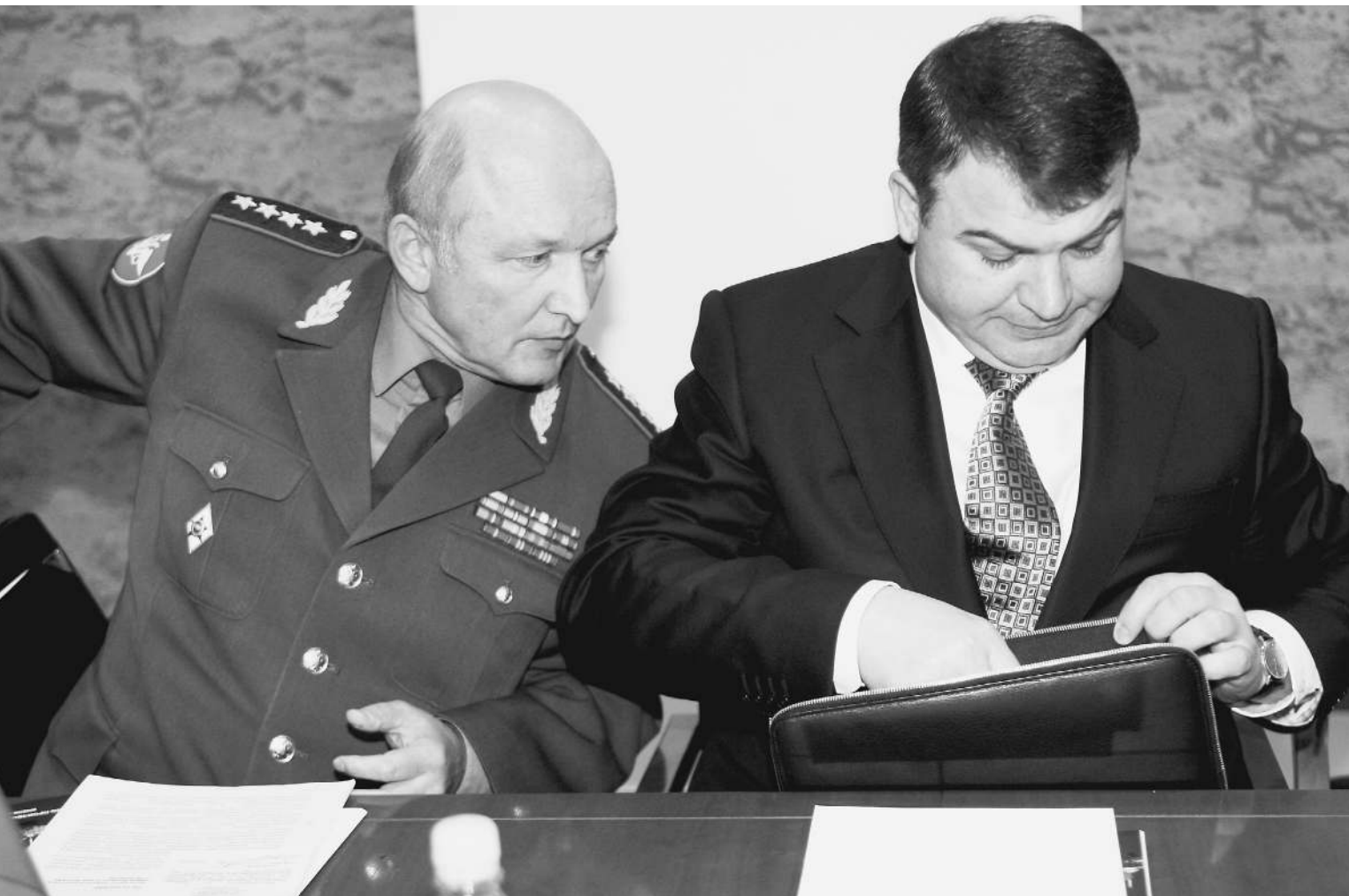
Анатолий Сердюков (справа) постигнет науку побеждать