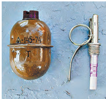
Та самая граната РГД-5.

Полковника оперировали 5 часов, после чего ввели в состояние искусственной комы. У спасенного им солдата, получившего после ЧП нервный срыв, диагностировали осколочные ранения мягких тка-