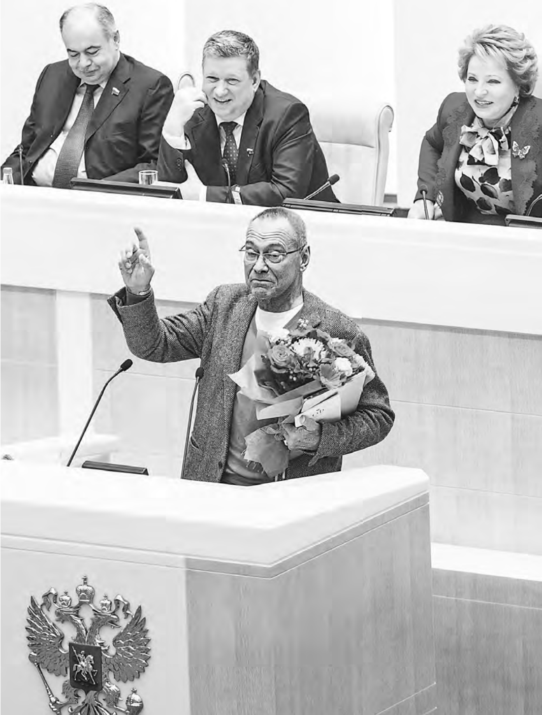
Андрей Кончаловский в Совете Федерации: Мы все, ни вы, ни я, не стали «горожанами», потому что у нас не было настоящей буржуазии. Я лично — крестьянин, у меня те же самые признаки крестьянской этики.

КОШЕЛЕК Плата россиян за жилищные услуги должна снизиться