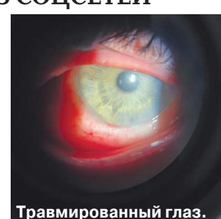
Травмированный глаз ребенка, повторившего опасный тренд из соцсетей.

По словам врачей, это уже третий случай термохимического ожога у