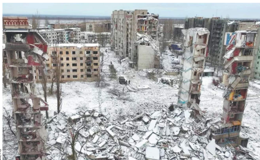
Сейчас «архитектура европейской безопасности» выглядит примерно так. Освобожденная Авдеевка. Декабрь 2024 года.