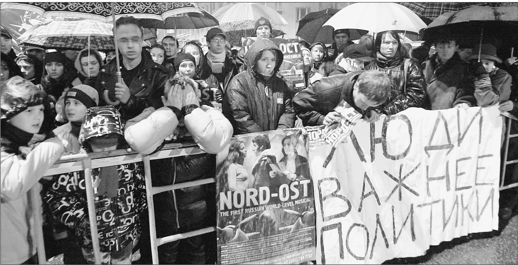
Люди важнее политики?