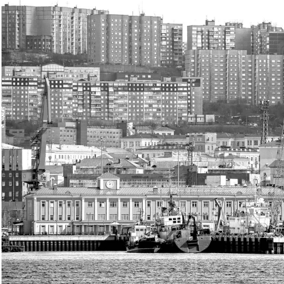
Морской вокзал станет настоящим центром города.

Прием имущества в областную собственность осуществляется в целях реализации концепции проекта «Новый Мурманск». Комплекс объектов проекта «Новый Мурманск» планируется разместить рядом с морским вокзалом, который входит в единую композицию проекта. После принятия решения Федеральным агентством по управлению государственным имуществом комплекс объектов будет зарегистрирован в составе областной собственности.