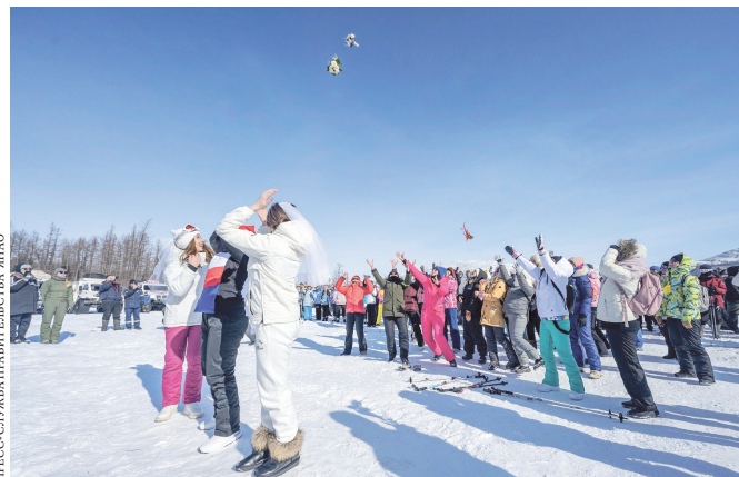
Бракосочетание в горах — незабываемое событие.