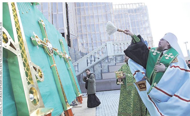
Церемонию провел митрополит Челябинский и Миасский Алексей.