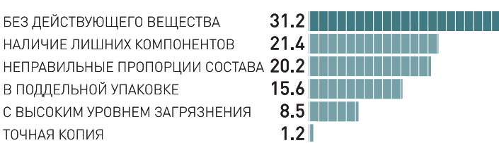
Иллюстрация: Илья Гаврилов / "Сетевые активы"

тню. Сфера телекоммуникаций также ищет подстраховку со стороны местных поставщиков либо азиатских вендоров, о чем уже заявили некоторые крупные игроки на рынке. В выигрыше те транснациональные корпорации, которые добились высокого уровня локализации и уже имеют производственные мощности на территории РФ. Негласный сигнал о смене курса на восток получили и строительные корпорации, которые зависели от поставок западного оборудования.