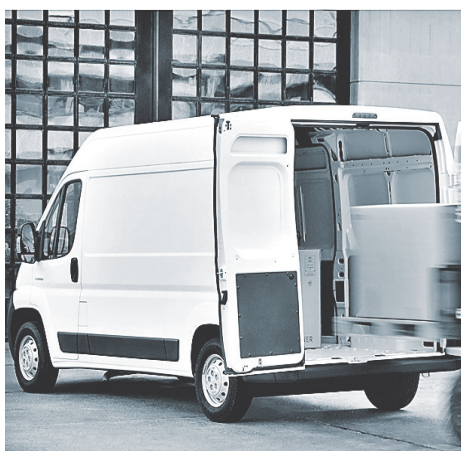
Малотоннажные грузовики пользуются спросом у мелкого бизнеса.