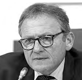
Борис Титов, уполномоченный при президенте РФ по защите прав предпринимателей:

—Промышленная ипотека—правильное решение. Но на практике все будет зависеть от деталей. Например, кредиты под пять процентов для приобретения площадей в индустриальном парке—это прекрасно, однако льготный период сроком всего один год—очень мало. Кроме того, если государство по прошествии года больше не сможет финансировать льготную программу, банку дается право в одностороннем порядке поднимать процентную ставку до рыночного уровня. Согласитесь, что такие условия сложно воспринимать как надежную базу для серьезного инвестиционного проекта.