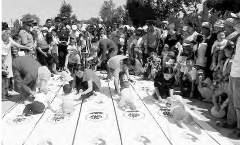
Необычные состязания прошли в честь Дня защиты детей в городе Оше. Комитет мэрии по делам молодежи провел «чемпионат ползающих малышей». В соревнованиях участвовали около сотни «спортсменов» в возрасте до года. Победители получили ценные подарки, а дети постарше — мороженое.