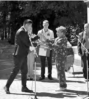
В России и Киргизии считают важным сохранять память о подвиге советских солдат.