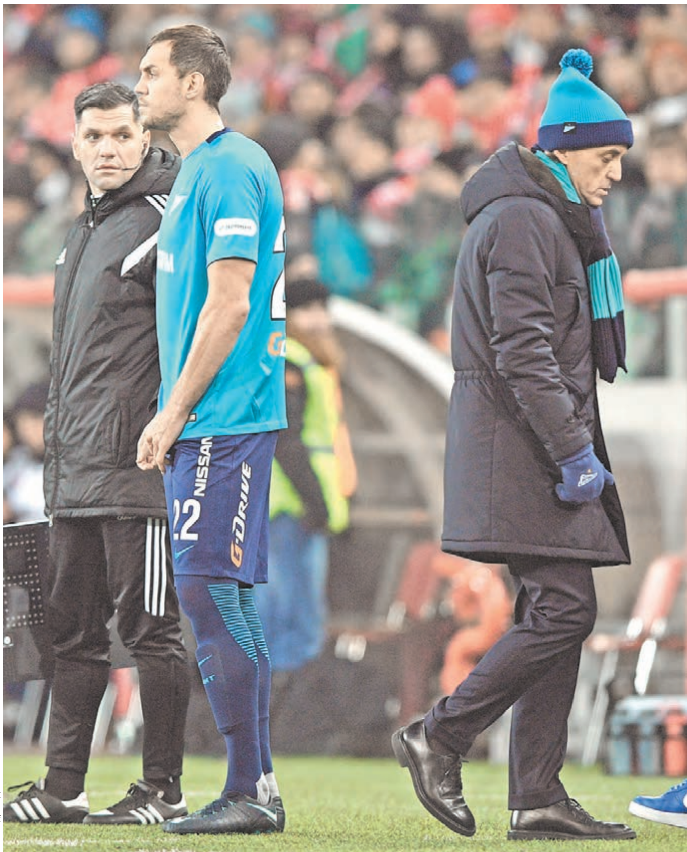
27 ноября 2017 года. Москва. Тушино. «Спартак» – «Зенит» – 3:1. Главный тренер питерцев Роберто МАНЧИНИ (справа) и форвард Артем ДЗЮБА.