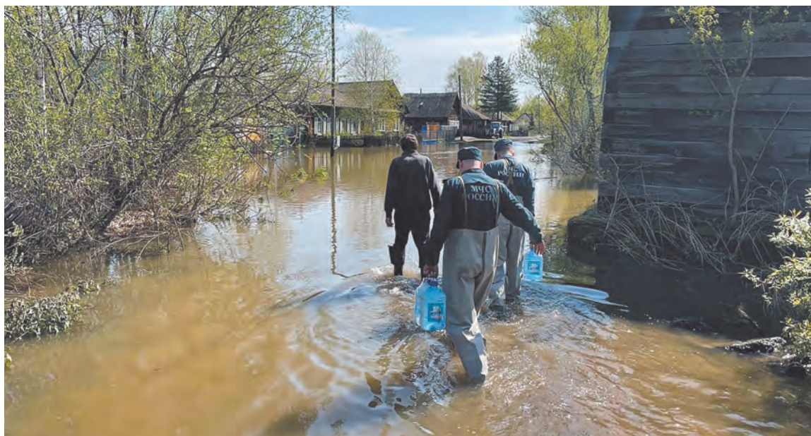
ГУ МЧС РОССИИ ПО КРАСНОЯРСКОМУ КРАЮ

Паводок в Сибири стихает, но до спокойствия еще далеко