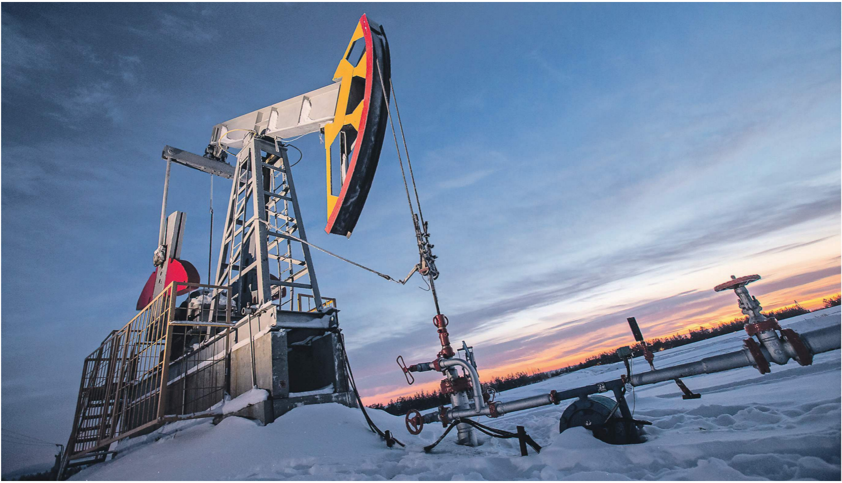
Повышение цены барреля нефти на один доллар приносит бюджету 65 млрд рублей