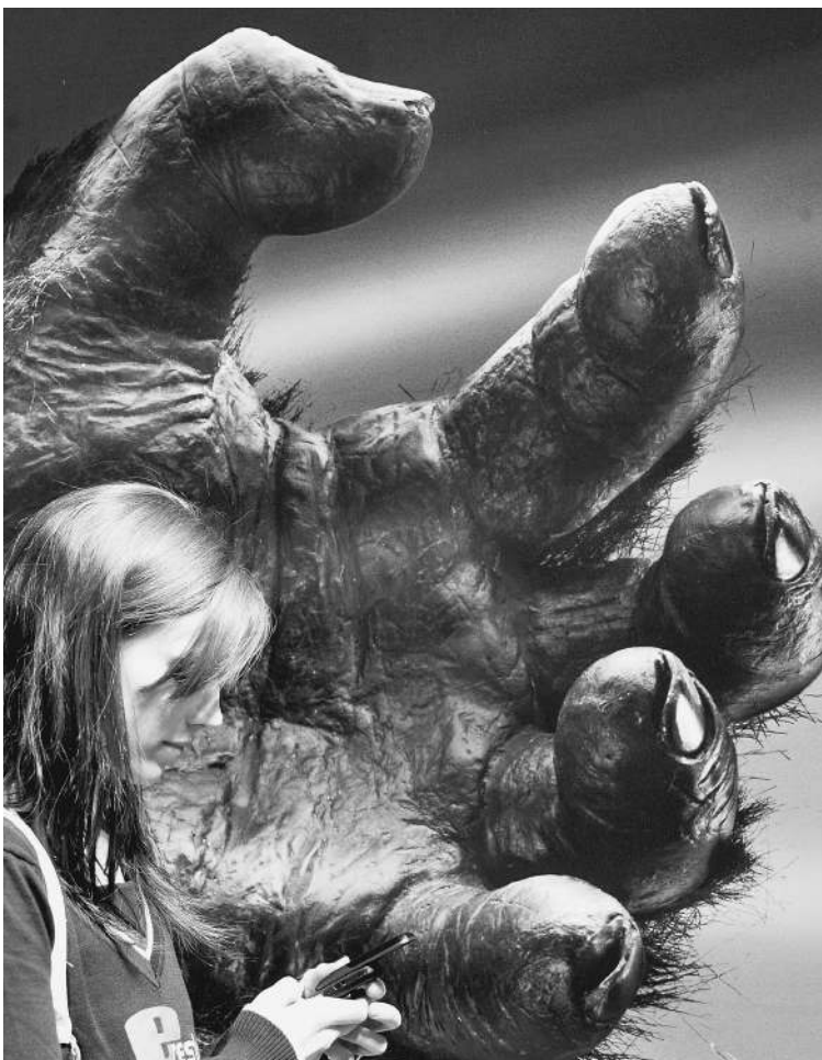
Кто этот зверь, убивающий наших детей?

В 1985 году на медкомиссии в военкомате выяснилось: из-за энуреза к армии не годен. Устроился ночным сторожем в ПТУ. Тихо жил в квартире своей матери. Ни друзей, ни тем более подруг у него не было. → стр. 9