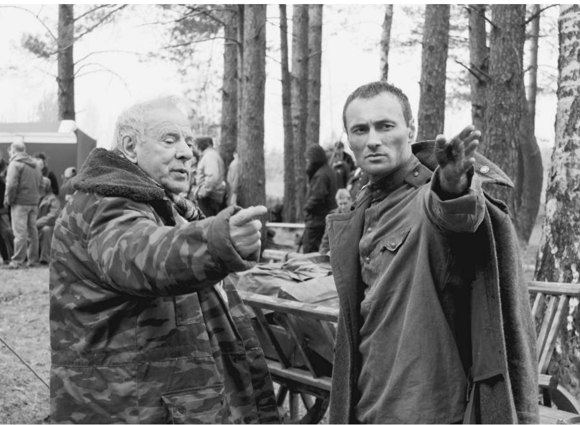
ПЕТР ТОДОРОВСКИЙ с актером ДМИТРИЕМ УЛЯНОВЫМ. Его знают прежде всего по сериалу «Московская сага» и фильму «72 метра»