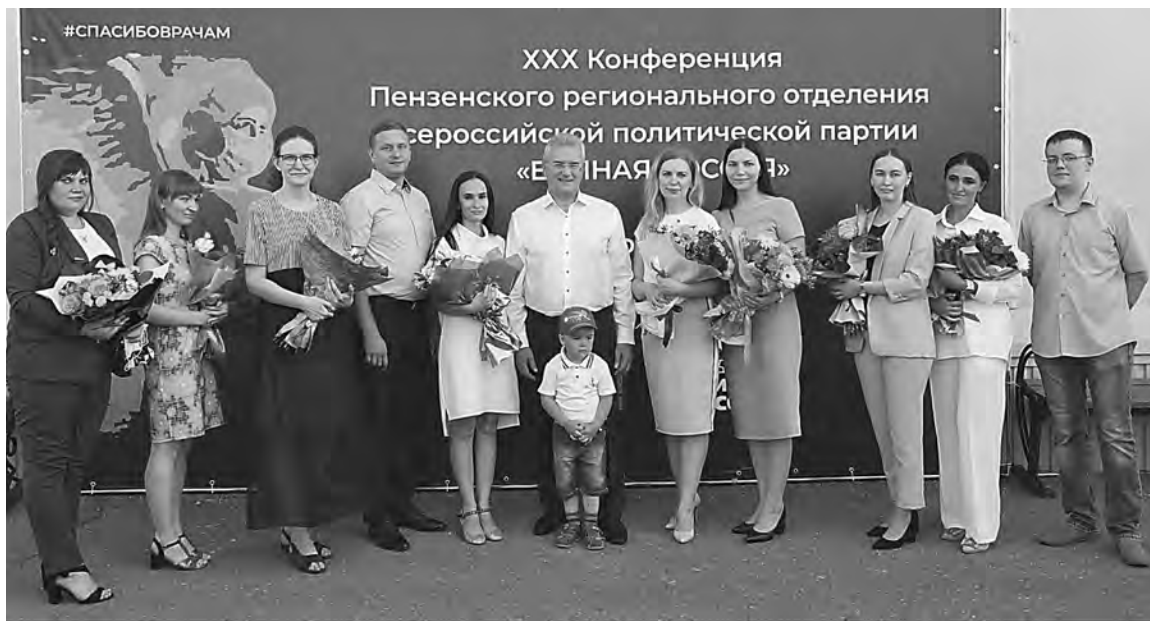
ПРАВИТЕЛЬСТВО ПЕНЗЕНСКОЙ ОБЛАСТИ