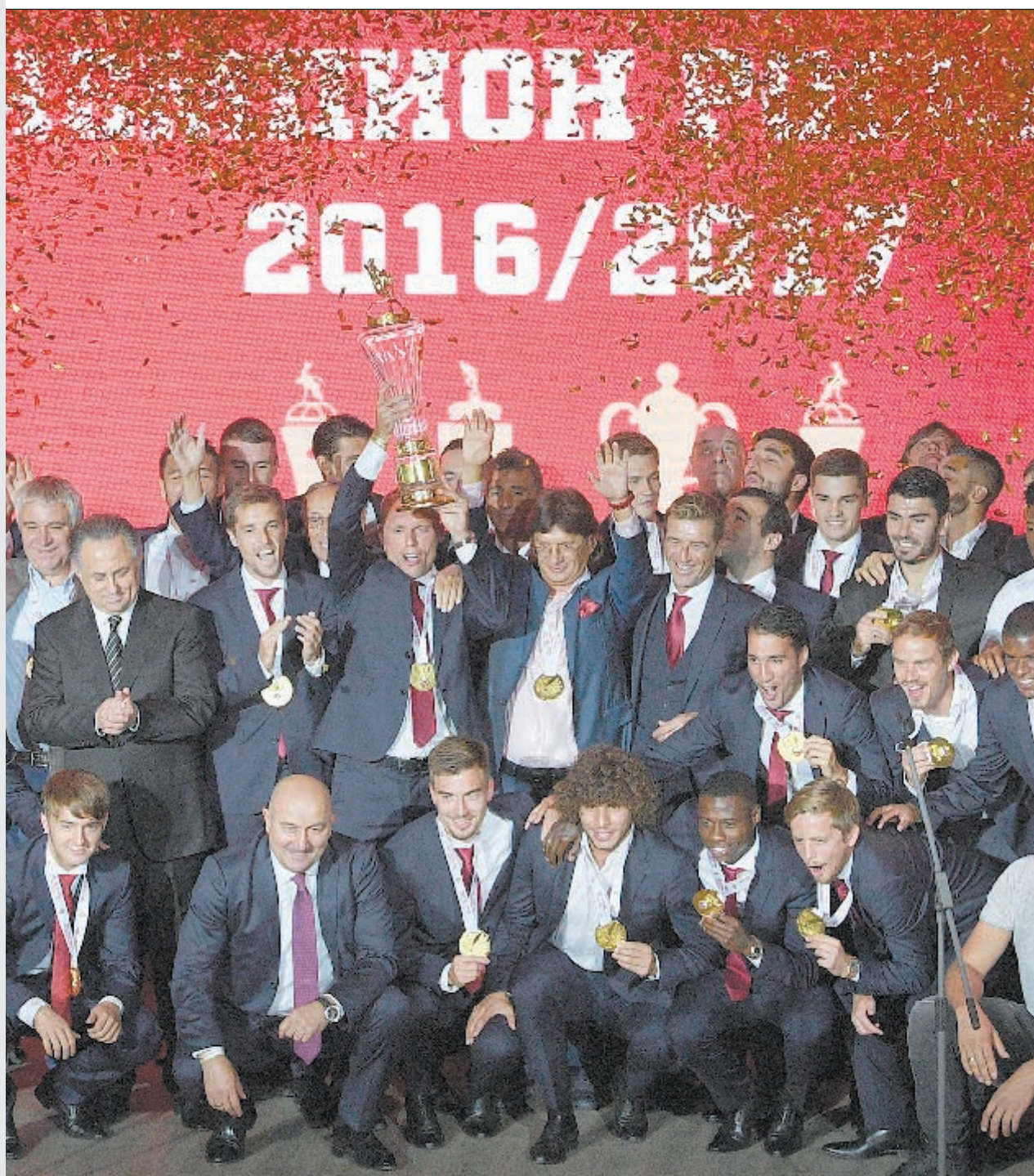
Суббота. Москва. Красно-белые со своим золотом.

В субботу в Москве прошла церемония награждения игроков, тренеров и персонала «Спартак» за победу в чемпионате России-2016/17. Все подробности - в нашем репортаже.