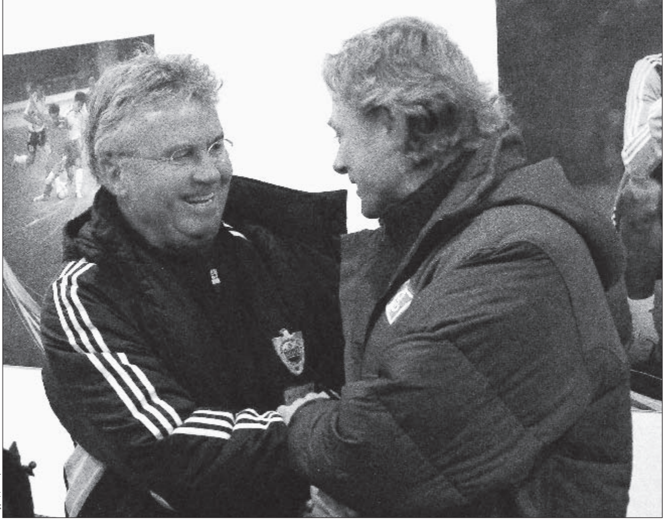
Вчера. Махачкала. Гус ХИДДИНК и Валерий КАРПИН.