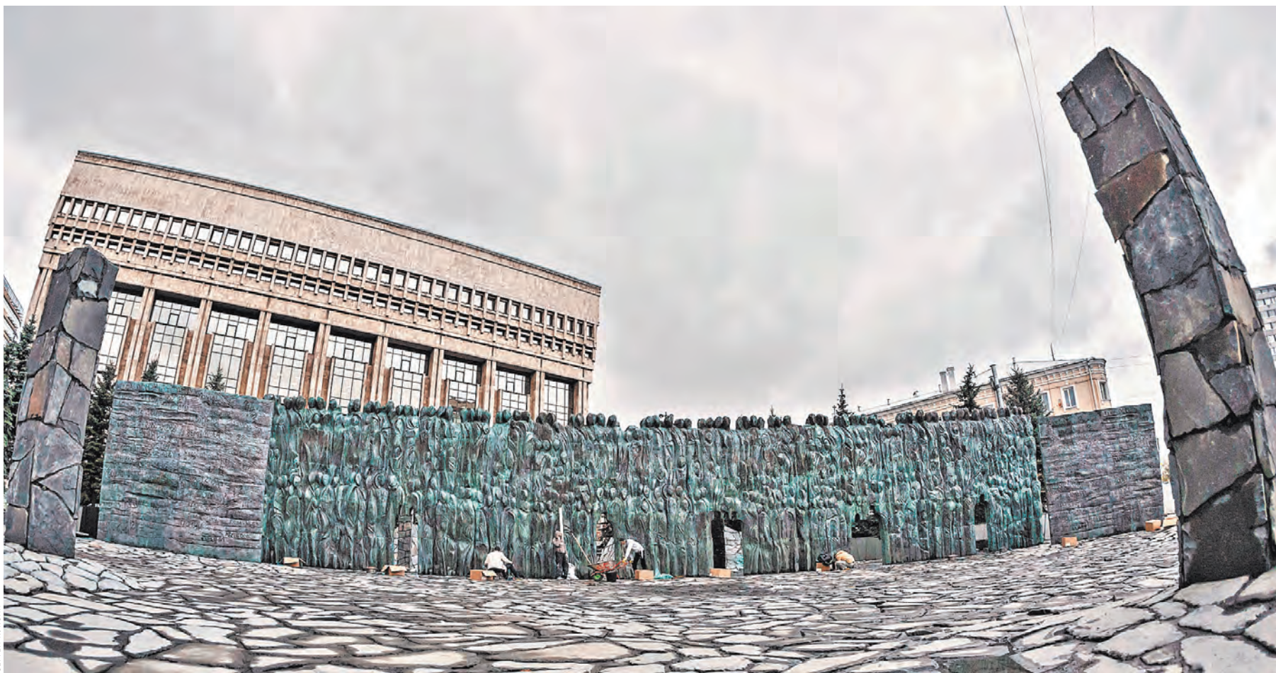
«Стена скорби» — общенациональный памятник жертвам политических репрессий, возведенный на народные деньги.