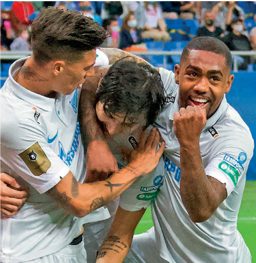
Суббота. Ростов-на-Дону. «Ростов» – «Зенит» – 0:2. 24-я минута. Эмилиано Ригони (слева) и Малком (справа) поздравляют Сердара Азмуна, который только что открыл счет