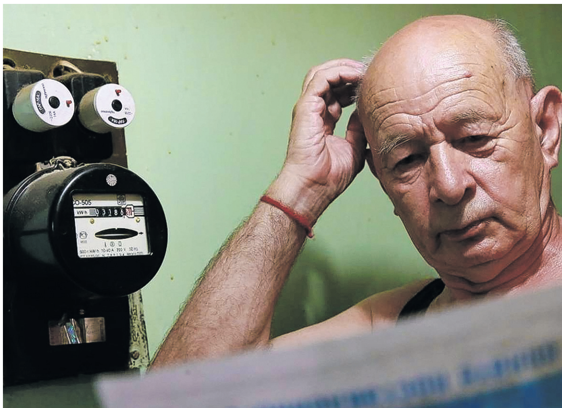
ВЛАДИМИР СМЕРГОВ ТАСС