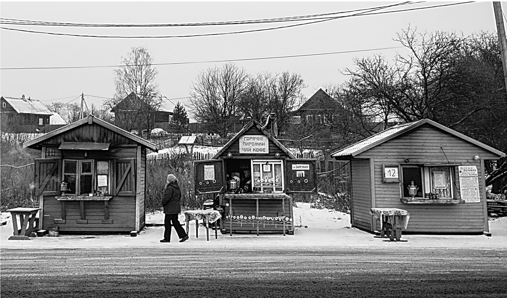
КОМПАНИИ ЧАЙСОВИЯ НОВОСТИ

1,8 миллиарда рублей получила Удмуртия на закупку лекарственных препаратов медицинского оборудования и медицинских изделий, а также расходных материалов по заключенным контрактам на 2022 год для оказания медицинской помощи в рамках территориальной программы ОМС.