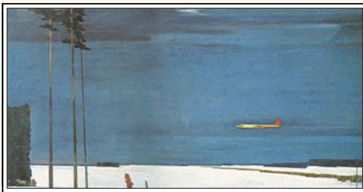
Г. Нисский Над снегами 1960 г.