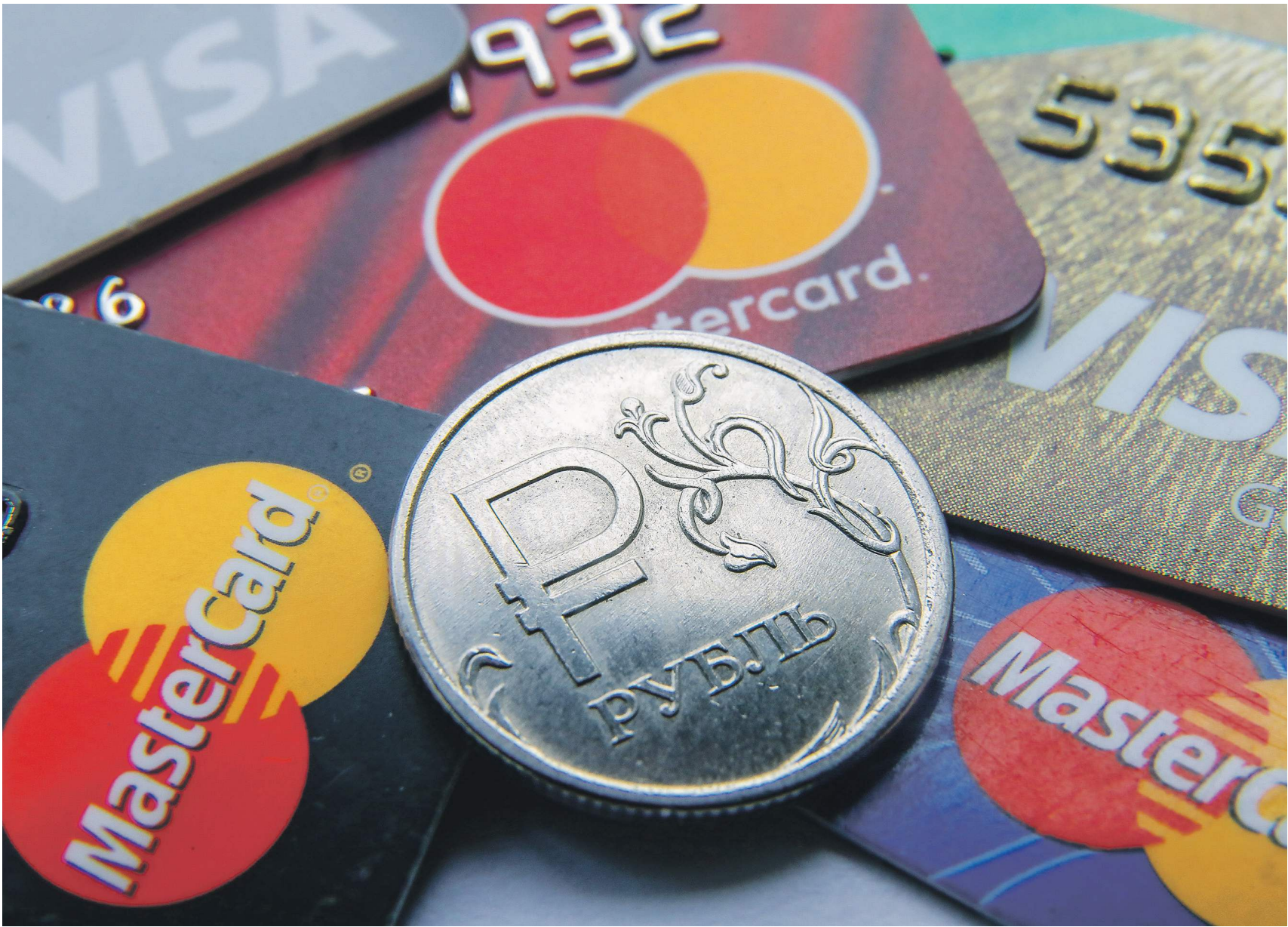
Сергей Козырев | Иллюстрация

Предполагается, что сервис позволит переводить деньги по выбранным реквизитам в системе быстрых платежей. В их число входят как номер телефона, так и другие уникальные реквизиты гражданина (например, ИНН). При этом банк, куда будут поступать деньги, работник сможет выбрать самостоятельно, без уведомления работодателя.