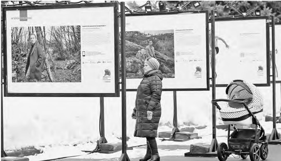
В Казани открылась Всероссийская фотовыставка «Герои России, какими их не видел никто». Экспозиция разместилась под открытым небом в мемориальном парке Победы. Несмотря на то, что фотопроект благотворительного фонда «Память поколений» существует уже третий год, интерес к нему по-прежнему высок.

Из них 27 будут построены в рамках нацпроекта «Демография». Местами в дошкольных учреждениях образования будут обеспечены еще шесть тысяч детей. Планируется, что это полностью решит проблему устройства малышей в детские сады. Сейчас дошкольные учреждения в регионе посещают более 220 тысяч детей от одного года до семи лет. При этом более трех тысяч ходят в частные детсады.