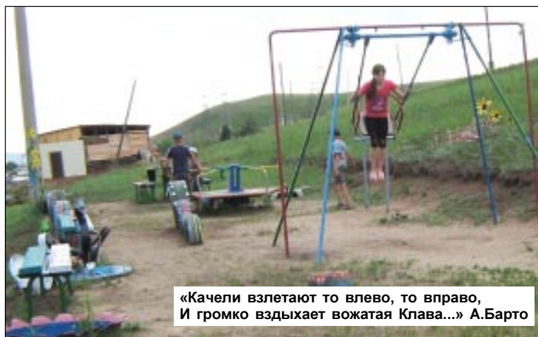
«Качели взлетают то влево, то вправо, И громко вздыхает вожатая Клава...» А.Барто