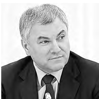
Вычеслав Володин, спикер Госдумы РФ:

— Ситуация с пандемией остается тревожной. В столице и ряде регионов приняты дополнительные меры безопасности. Если нет противопоказаний, лучше защитить себя, все возможно для этого есть. Защищает вакцина, но никак не липовая справка. Между тем уже возбуждены уголовные дела, задержаны подозреваемые в изготовлении и торговле поддельными сертификатами о вакцинации. ... Шустрых «бизнесменов», рассчитывающих разбогатеть на пандемии, ждет наказание. Совершенно очевидно: необходимо жестко пресекать нелегальную торговлю поддельными медицинскими документами. Это обязанность правоохранительных органов. Но и долг каждого — не покупать поддельные сертификаты.