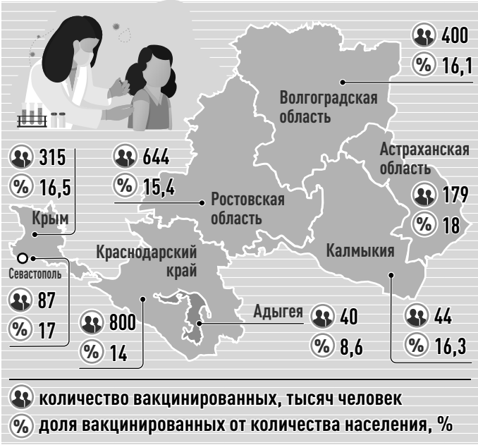
ИНФОГРАФИКА: РФГ, ИРИНА ТЕПОВА