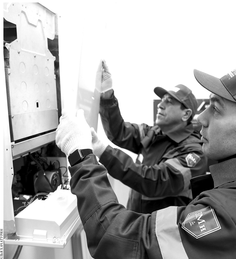
При проверке газового оборудования специалисты компании обнаруживают множество нарушений.