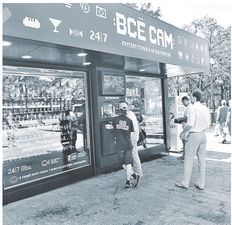
Магазин-робот полностью разработан и собран в России.