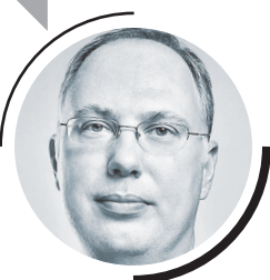
КИРИЛЛ ДМИТРИЕВ, ГЕНЕРАЛЬНЫЙ ДИРЕКТОР РОССИЙСКОГО ФОНДА ПРЯМЫХ ИНВЕСТИЦИЙ (РФПИ)