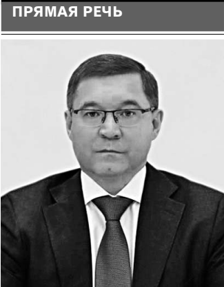
Владимир Якушев, министр строительства и ЖКХ РФ:

—Если муниципалитет рассчитывает в следующем году на один миллион рублей, документы он готовит на 1,3 миллиона, — пояснил министр строительства и ЖКХ Калининградской области Сергей Черномаз. — При этом над ПСД мы работаем заранее — документация на 2020 год должна быть выполнена до конца текущего года и с запасом на дополнительные объекты сверх установленных планов. ●