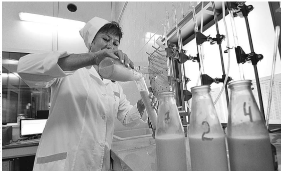
Все молоко проходит строгую проверку качества.

По оперативным данным Министерства сельского хозяйства, в России суточный объем реализации молока сельскохозяйственными организациями составил 44,1 тысячи тонн, что больше аналогичного показателя 2018 года на 8,1 процента (40,8 тысячи тонн). Средний надой молока от одной коровы за сутки составил 15,98 килограмма, что на 1,31 килограмма выше, чем годом ранее. Вологодчина — в лидерах по обоим показателям наряду с Краснодарским краем. В регионе среднесуточный надой на одну корову составил 21,08 килограмма, что выше прошлогоднего показателя на 1,66 килограмма. С начала года произведено 486 тысяч тонн сырого молока — на 27 тысяч тонн больше, чем в аналогичном периоде 2018 года.