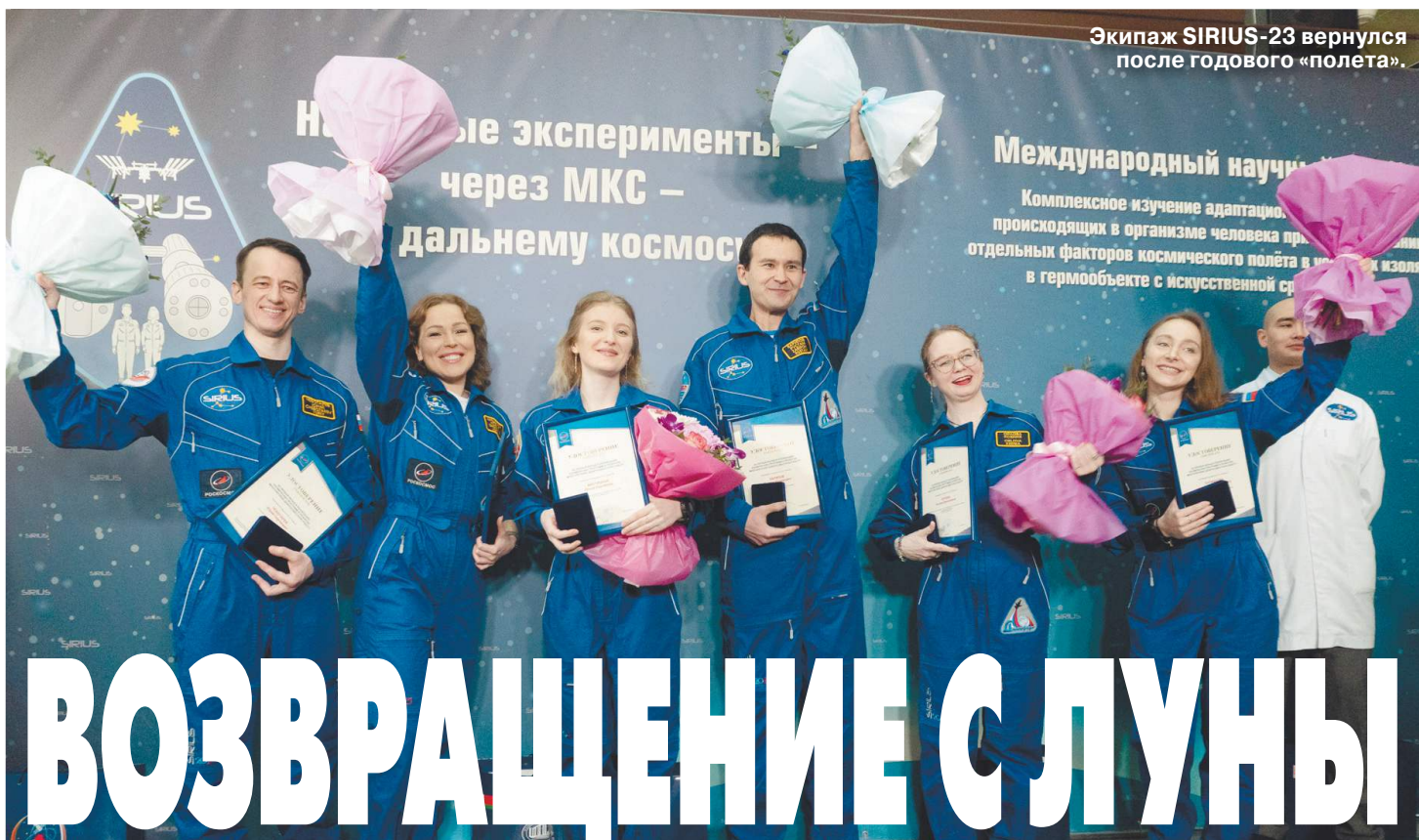
Экипаж SIRIUS-23 вернулся после годового «полета».