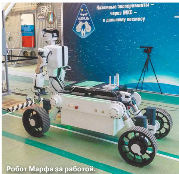
Робот Марфа за работой.