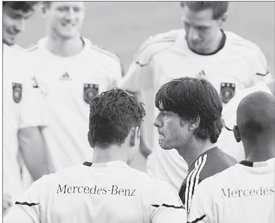
Йоахим ЛЕВ и его сборная - среди главных фаворитов предстоящего Евро-2012.

Главный тренер немецкой сборной надеется, что его игроки не будут ослеплены победами во всех десяти матчах отборочного турнира к Евро-2012 Йоахим ЛЕВ: «СБОРНАЯ РОССИИ НЕ ВХОДИТ В МОЙ СПИСОК ФАВОРИТОВ, НО...»