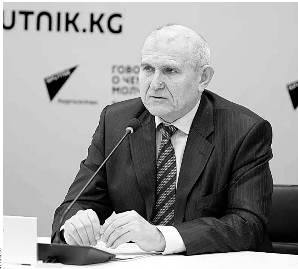
Николай Удовиченко: Русский язык позволяет населению Киргизстана добиваться значимого прогресса.

— Товарооборот между странами вырос на 46,6 процента, достигнув 2,5 миллиарда долларов, — подчеркнул Николай Удовиченко, добавив, что оперирует данными Федеральной таможенной службы Рос-