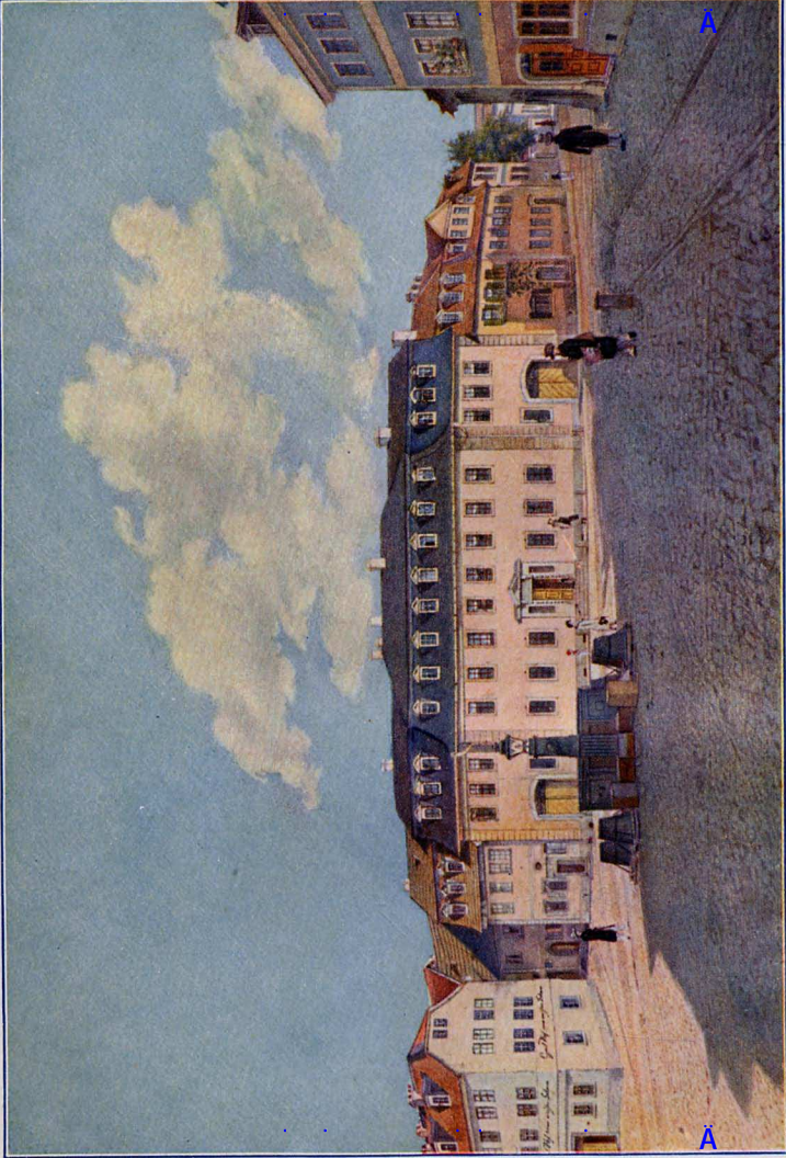
Das Goethe-Haus in Weimar. Nach einem Aquarell von E. Köfel.