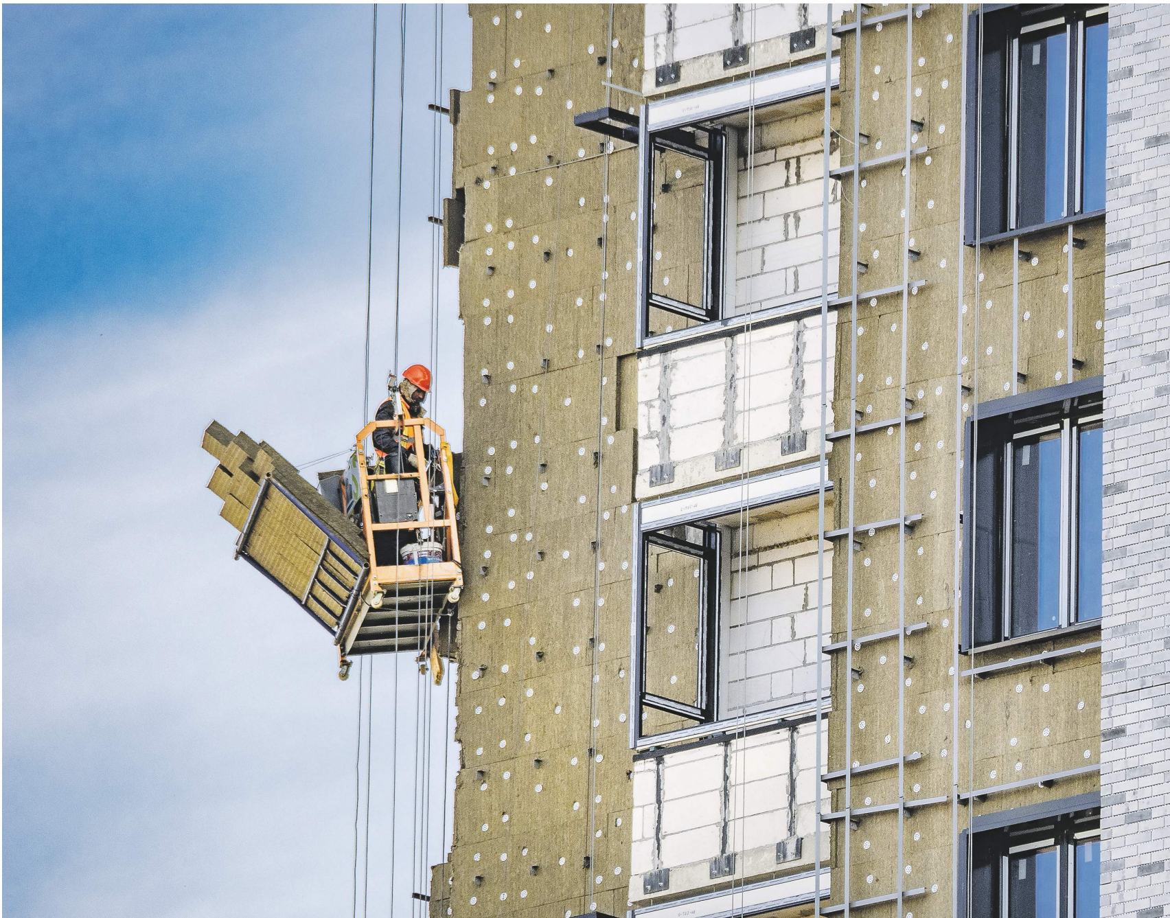
Константин Кошкин / «Известия»