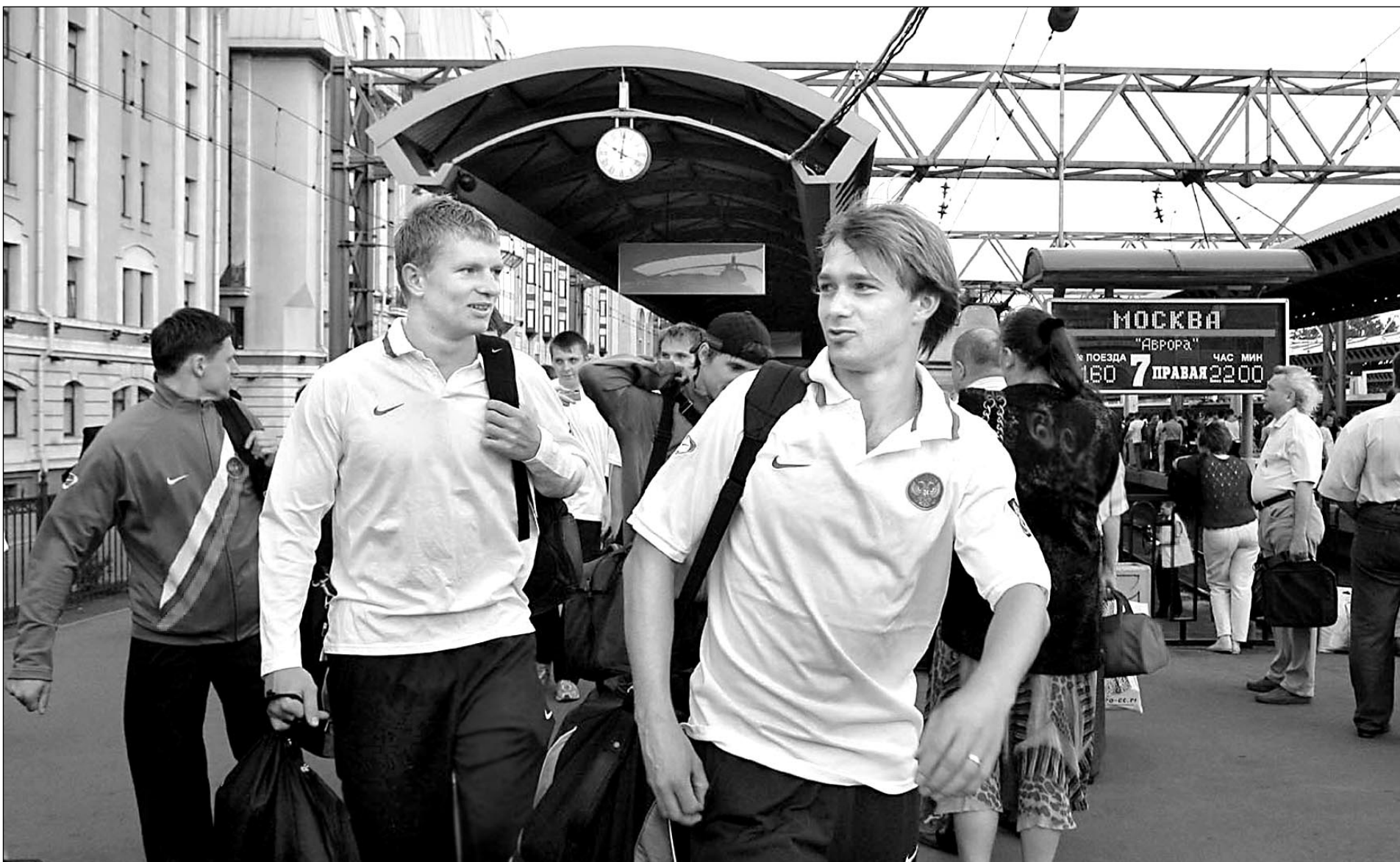
Вчера. Санкт-Петербург. Московский вокзал. 22.02. Денис КОЛОДИН и Дмитрий СЫЧЕВ.

Вчера футболисты сборной России вслед за своим главным тренером отправились в Санкт-Петербург. От Комсомольского проспекта в Москве до Невского в Питере команду сопровождали корреспонденты «СЭ».