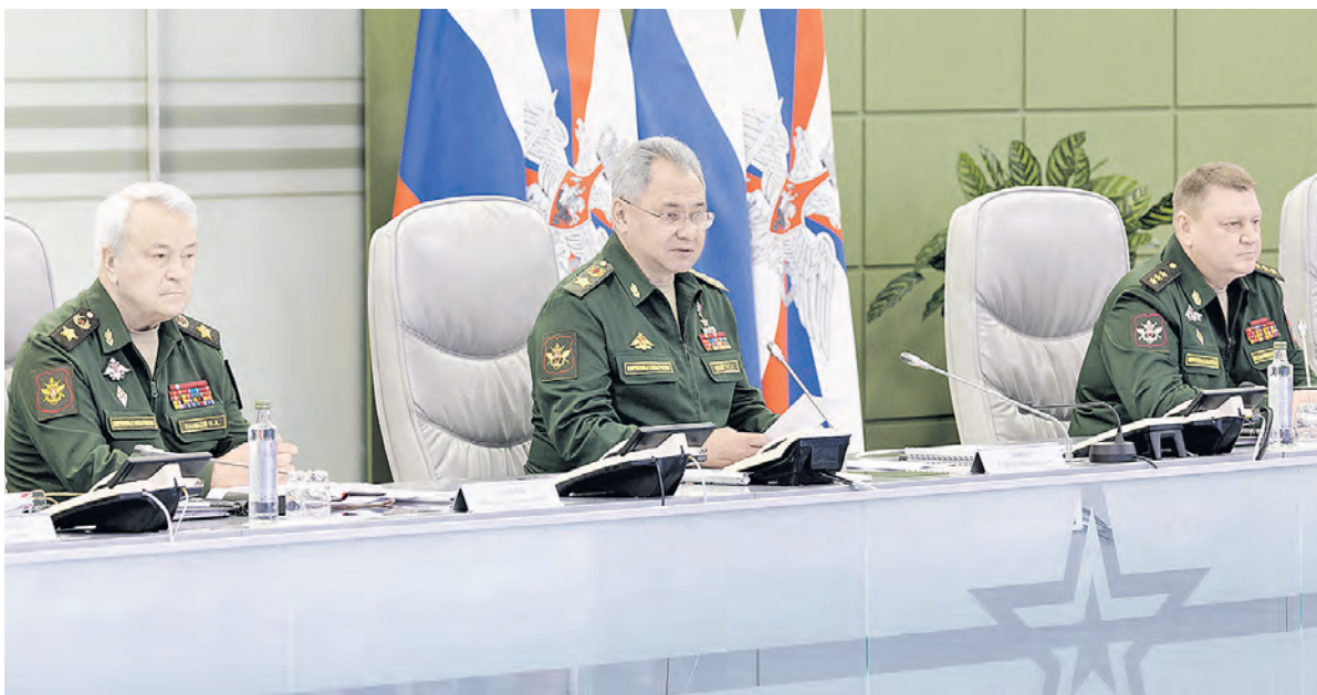
Выступает министр обороны Российской Федерации генерал армии Сергей Шойгу

Первого сентября впервые начались занятия в недавно созданных Военно-инженерной академии в Нахабино, Донецком высшем общевоинском командном училище, Иркутском суворовском военном училище. Всего же к работе приступили 38 высших и 33 довузовских учебных заведения