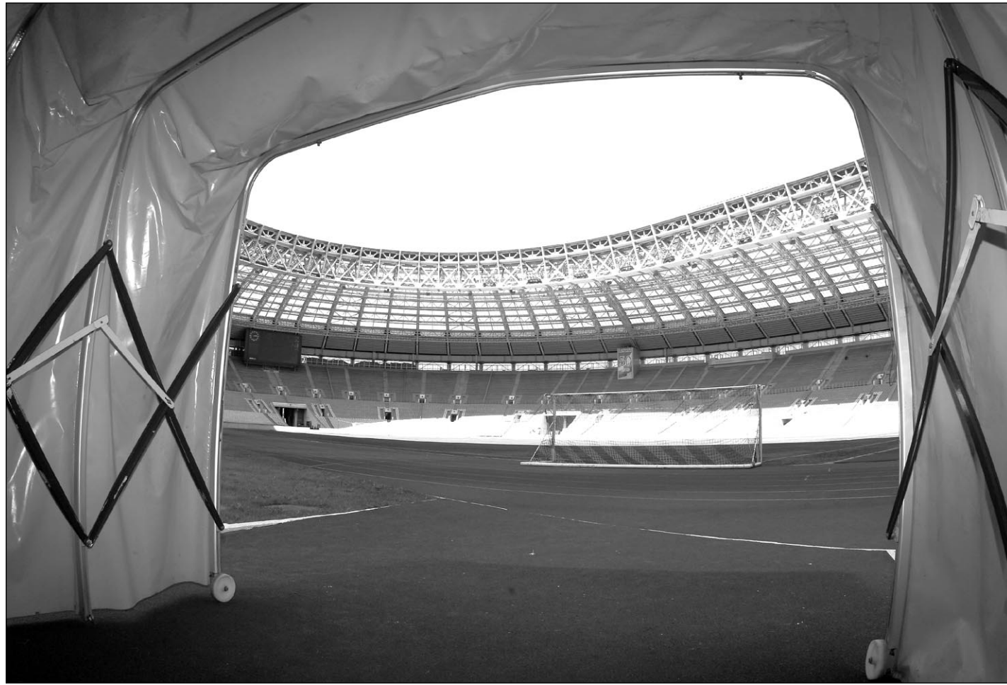
Вчера, Лужники. К финалу все готово. Сегодня через этот тоннель команды выйдут на поле.

Но команда Олега Долматова к исходу часа забила три мяча, на которые спартаковцы ответили затем только одним голом. «Такого ЦСКА не хватало нашему футболу!» - написала тогда наша газета. Сегодня армейский клуб стабилен и уверен в себе, а «Спартак», хотя и выбрался из трясины посредственности, пока перестройку не завершил.