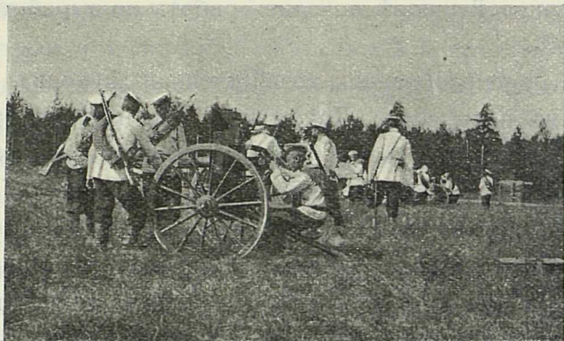
Пулеметная рота 2-ой гвард. пех. дивизии на стрельбище в Ораниенбауме, в 1906 году.

„Распределение личного состава и имущества произвести по указанию начальников дивизий и гвардейской стрелковой бригады.