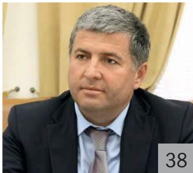
Ш. М. ДАБИШЕВ , министр финансов Республики Дагестан