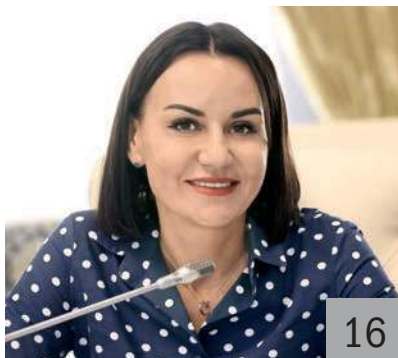
Н. Г. БРЮХАНОВА , министр финансов Ульяновской области